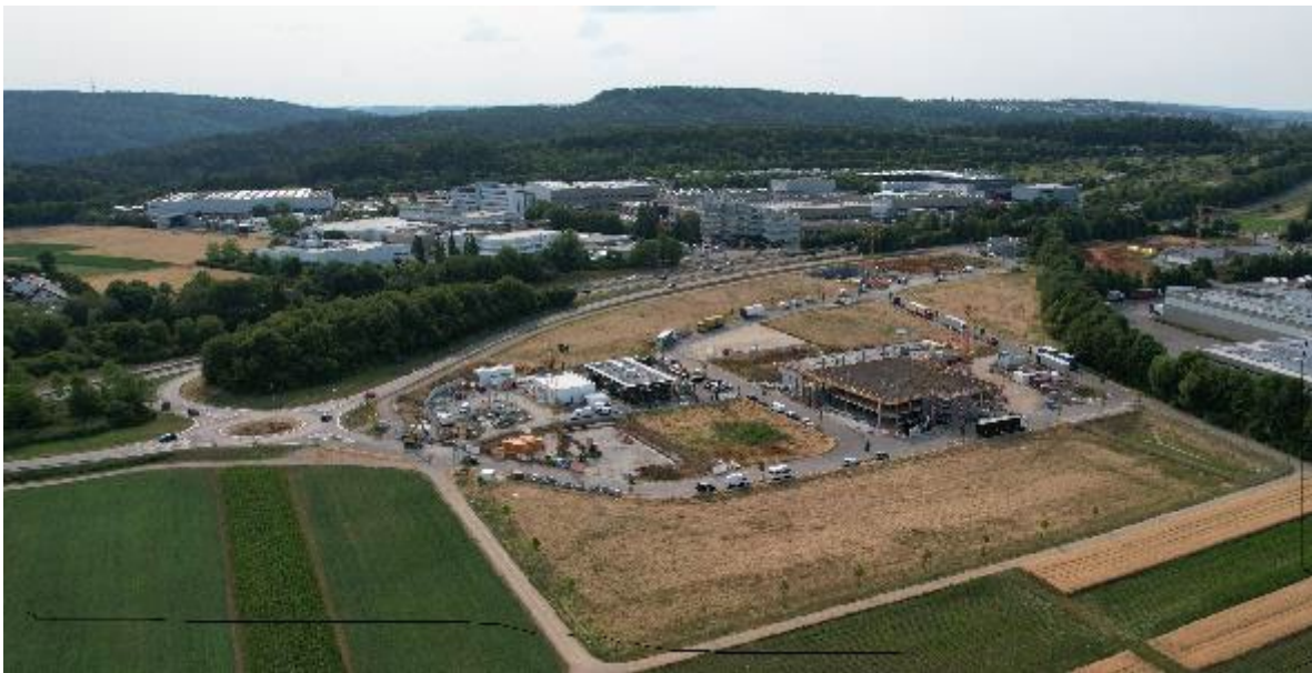
Foto aus Südosten mit Riedwiesen zu ca. 1/3 gebaut; unten noch leeres Grdst 21/20 für Aichum

Das von Karl Schlecht geplante Aichtaler Zentrum – genannt „ AICHUM “ soll unter anderem der künftig zentrale Sitz der 1998 gegründeten gemeinnützigen Stiftung „KSG“ im neuen Gewerbegebiet „Südliche Riedwiesen“ werden. Bewusst nahe ihrem Ursprung - dem nahen von ihm 1967 für den Bau von großen Betonpumpen gegründeten Aichtaler-Putzmeisterwerk - soll es verkehrsgünstig und architektonisch herausragend ein Schmuckstück und Landmark werden für die dort nun aufstrebende Aichtaler Industrie. 1968 war Putzmeister für sein neues Betonpumpenwerk der erste Pionier-Investor für Aichtal – Details dazu siehe SM 05111 .