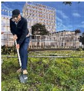
Spatenstich am 91. Geburtstag 231028 vor dem Aichum-Plakat.

Seither bearbeitet im und als KSG-Projekt Q:\SP\9924-KSG 2030\5 Aichum; digital geführt -auch im WEB- von Herrn Dr. Frank Prochiner (MUNITEC) und im WEB gepflegt von Herrn Jonas Merkle ( mej@ksfn.de ; 07127 599 565) auch danach ab 10. Juli 2023 Realisierungs-Übergang von KSG auf Primus in deren AICHUM- Bau-Projekt PRP2307-AichPrim. s. https://karl-schlecht.de/ksc/primus bzw. intern W:\2 Objekte\1 PRIMUS\PIK-00 ProjEntw\PRP 2307-1_Aichum 1 (-2,-3). Rot umrandete Grundstücke 20/21 sind Aichum-Gelände.