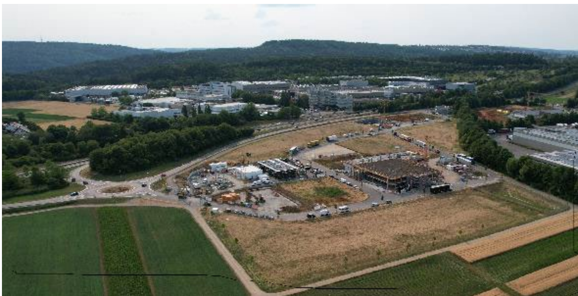
Foto 2023 aus Südosten mit Riedwiesen zu ca. 1/3 gebaut; unten noch leeres Grdst 21/20 für Aichum

Dahe der Garagenentwurf auf dem inzwischen frei gewordenen Grds 19- mit günstigerem und auch für andere freien PKWStellplätzen (.oben)